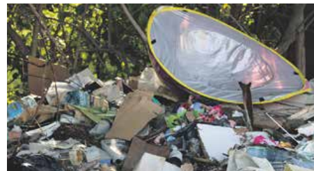
Mont Vernon : à côté des poubelles !

Incivilité, mauvaise volonté affirmée ou je-m'en-foutisme ? La Collectivité a annoncé mettre en place une campagne de nettoyage, gratuite pour les particuliers, afin d'enlever les encombrants qui pourraient notamment constituer des projectiles en cas d'ouragan. Cependant le bon sens veut que l'on ne se débarrasse pas de tout et n'importe